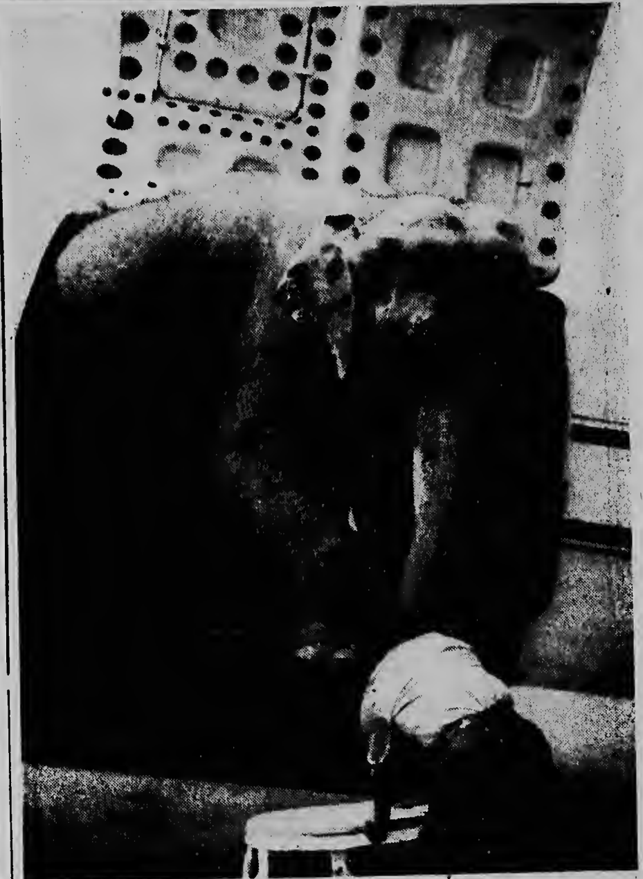
E olifante di Circo Dumber bahanda di un avian na vliegveld Dakota.

W A T K A N K A N K A N K A N A L L E E N